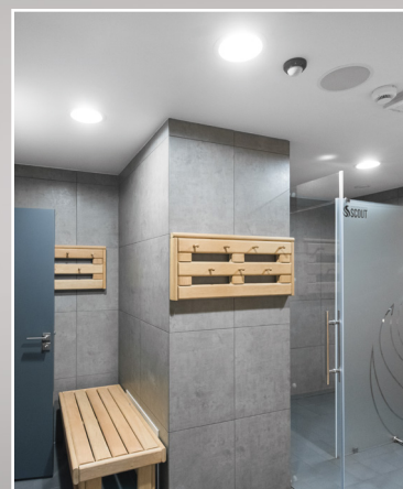
SATURN S-230 to wysokowydajne i estetyczne oprawy oświetleniowe w technologii LED o szerokiej gamie zastosowań.

ZASILANIE: przetwornica impulsowa o wysokiej sprawności i współczynniku mocy >0,95 gwarantuje stałe natężenie oświetlenia przy napięciu zasilającym od 184V~ do 253V~, w trybie awaryjnym wbudowany akumulator.